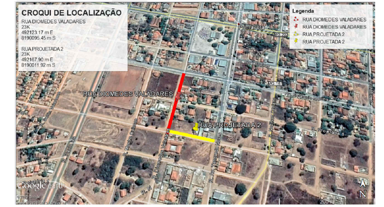
03 CROQUI DE LOCALIZAÇÃO SEM ESCALA