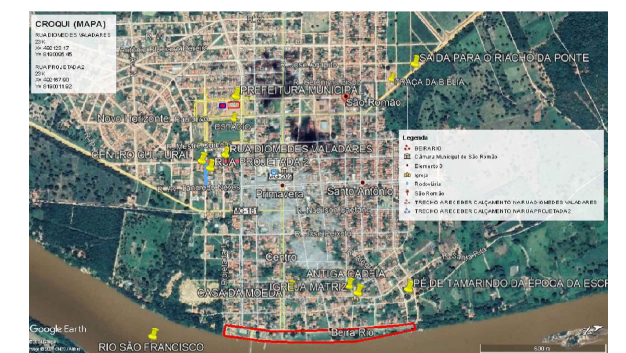
04 CROQUI (MAPA) SEM ESCALA