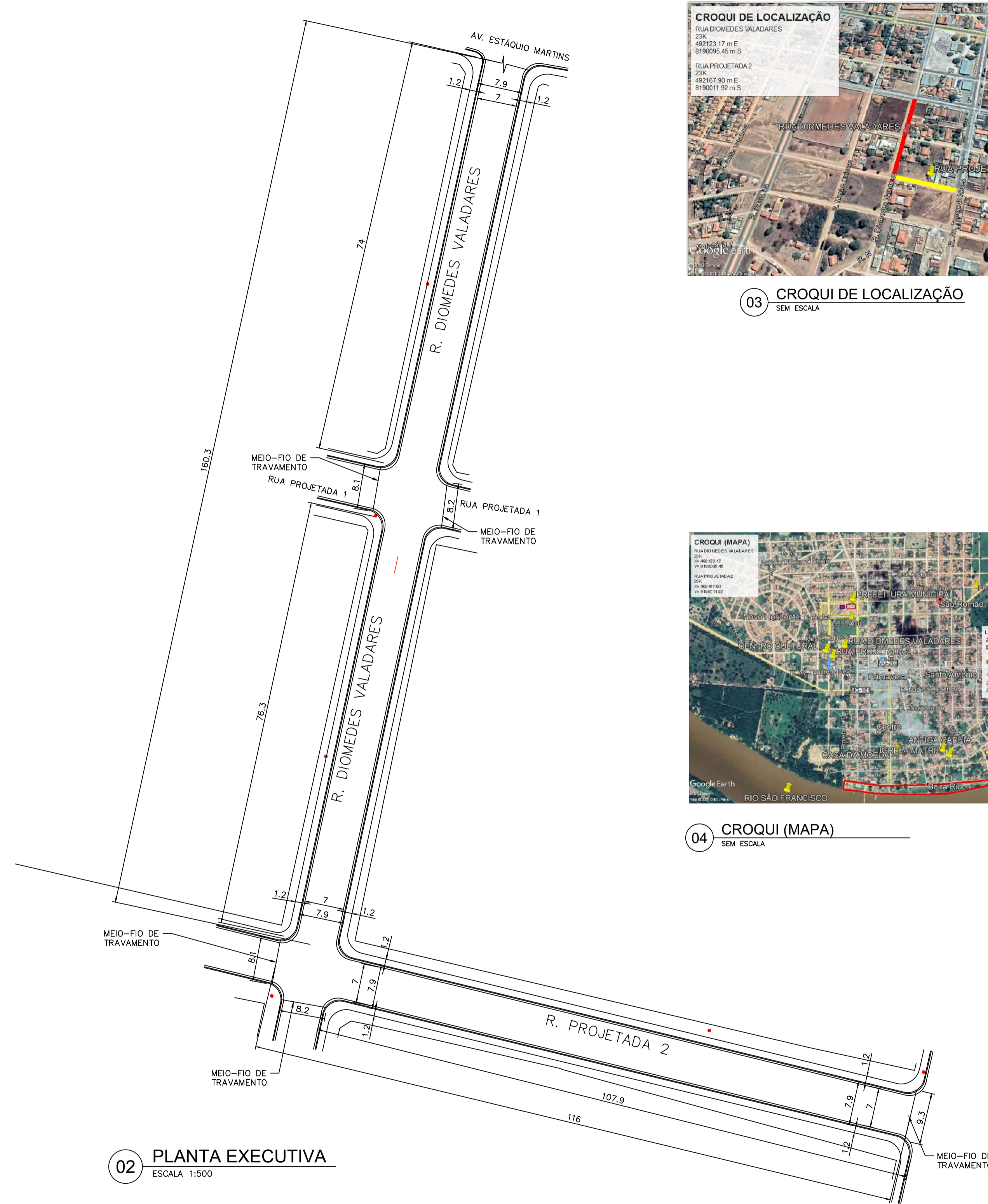
02 PLANTA EXECUTIVA ESCALA 1:500