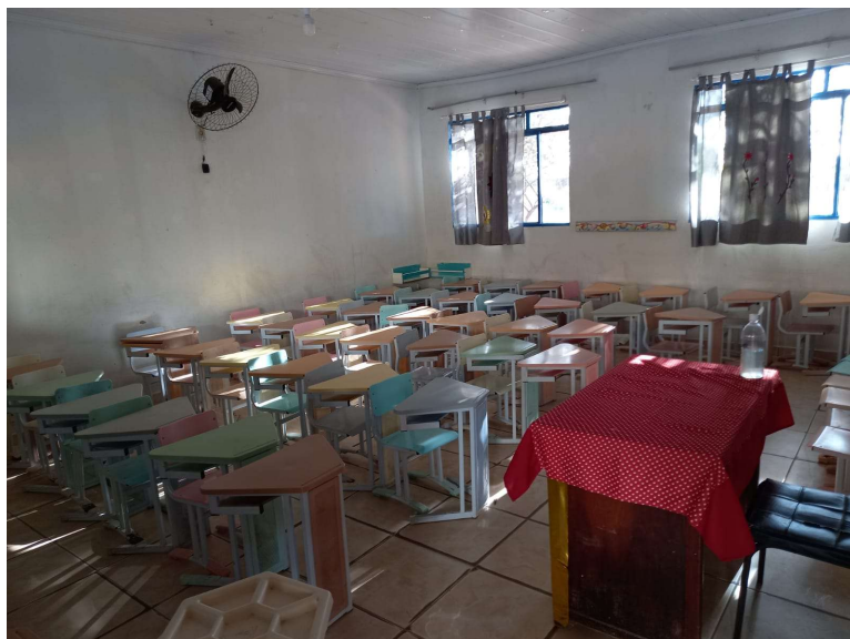
Figura 4: SALA DE AULA