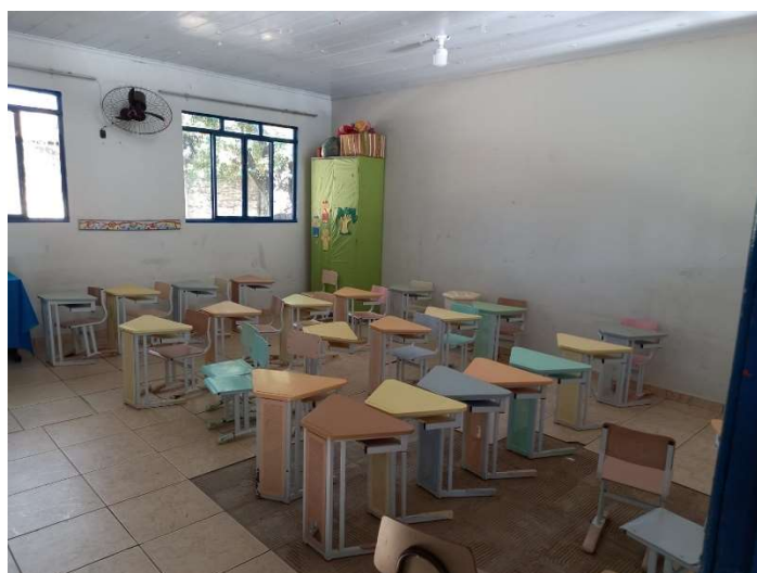
Figura 6: SALA DE AULA