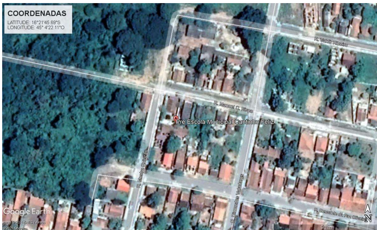
Figura 1: CROQUI DE LOCALIZAÇÃO