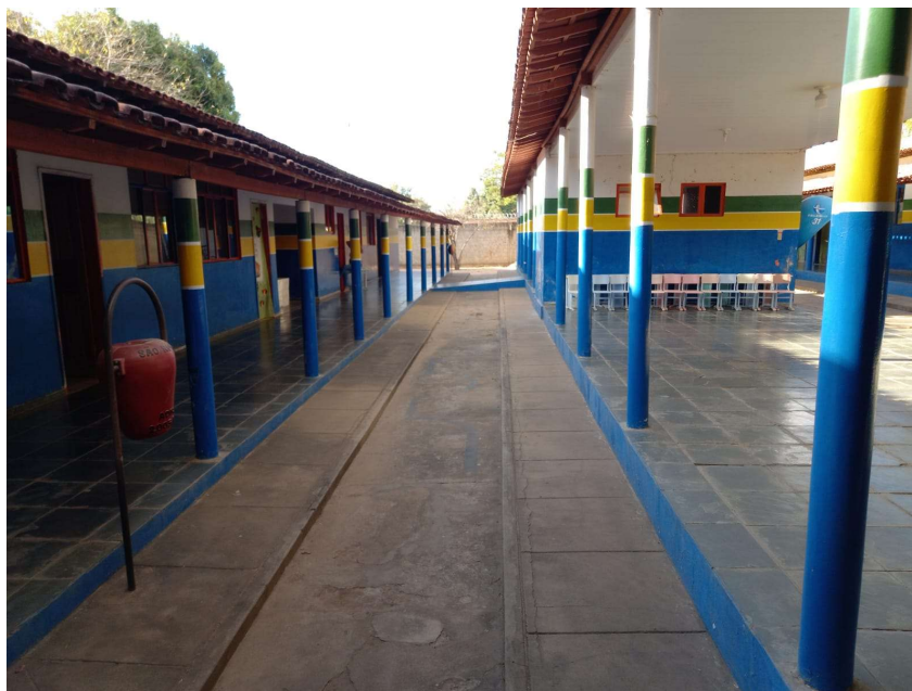
Figura 2: ÁREA EXTERNA DA ESCOLA