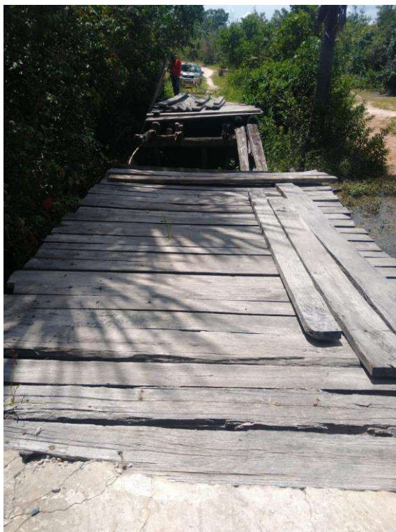
IMAGEM 02: PONTE 2 NA COMUNIDADE DO ESCURO