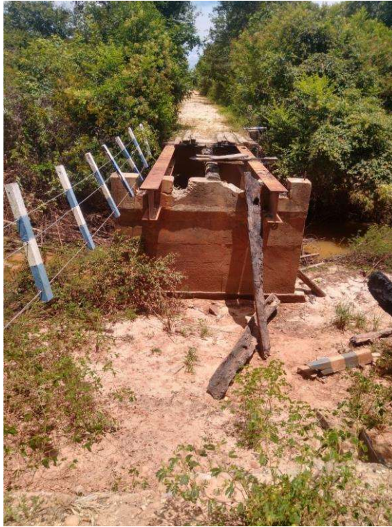
IMAGEM 03: PONTE NA COMUNIDADE DA LAGOA CUMPRIDA