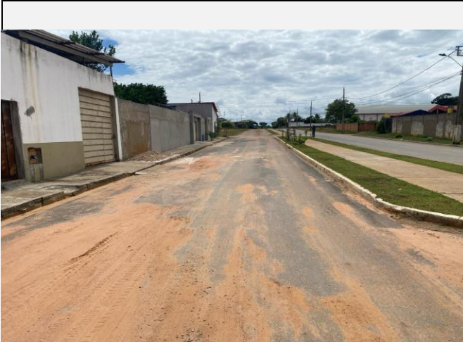
Localização da fotografia FOTO Data da fotografia AVENIDA PAULO IVO 1 05/04/2024