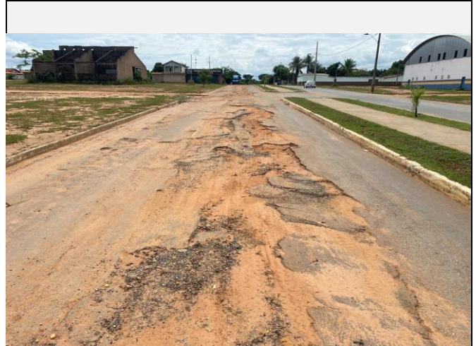
Localização da fotografia FOTO Data da fotografia AVENIDA PAULO IVO 6 05/04/2024