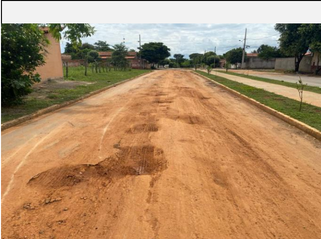
Localização da fotografia FOTO Data da fotografia AVENIDA PAULO IVO 9 05/04/2024