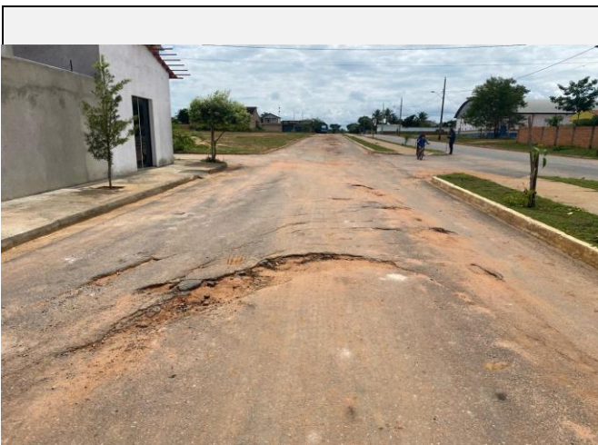
Localização da fotografia FOTO Data da fotografia AVENIDA PAULO IVO 3 05/04/2024