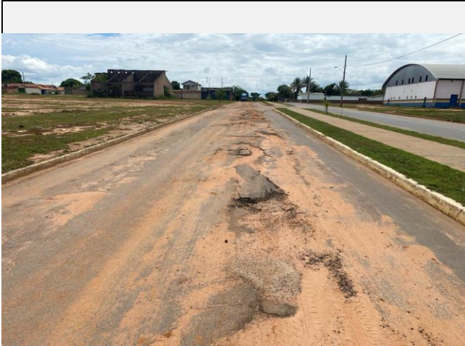
Localização da fotografia FOTO Data da fotografia AVENIDA PAULO IVO 5 05/04/2024