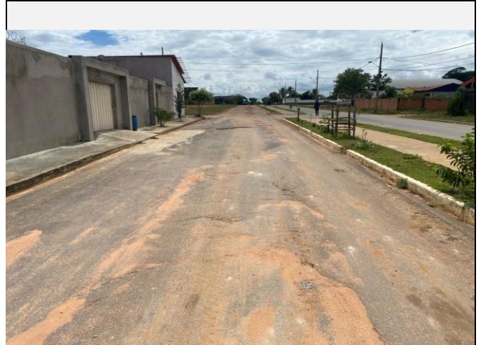
Localização da fotografia FOTO Data da fotografia AVENIDA PAULO IVO 2 05/04/2024