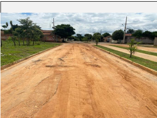
Localização da fotografia FOTO Data da fotografia AVENIDA PAULO IVO 11 05/04/2024