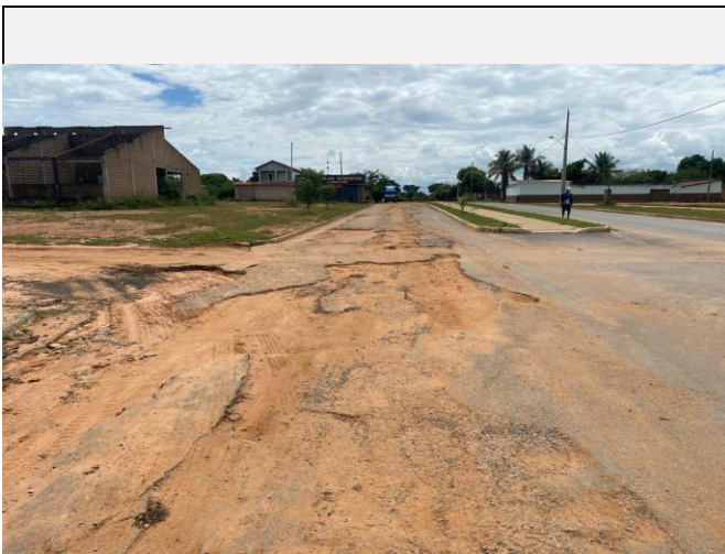
Localização da fotografia FOTO Data da fotografia AVENIDA PAULO IVO 7 05/04/2024