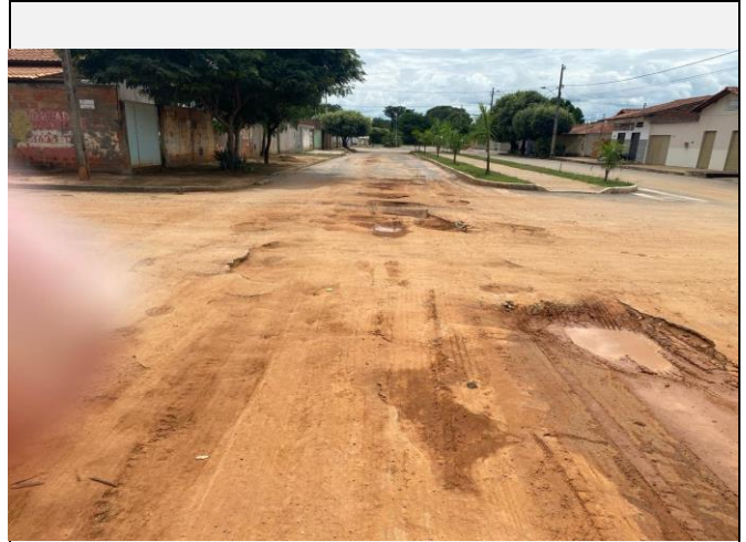
Localização da fotografia FOTO Data da fotografia AVENIDA PAULO IVO 10 05/04/2024