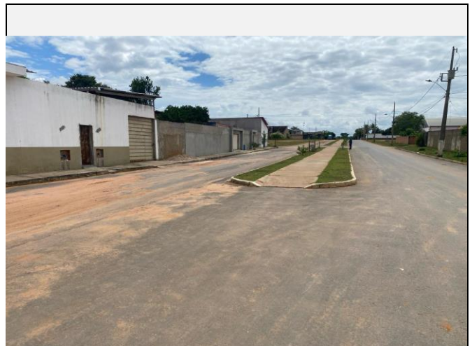
Localização da fotografia FOTO Data da fotografia AVENIDA PAULO IVO 12 05/04/2024